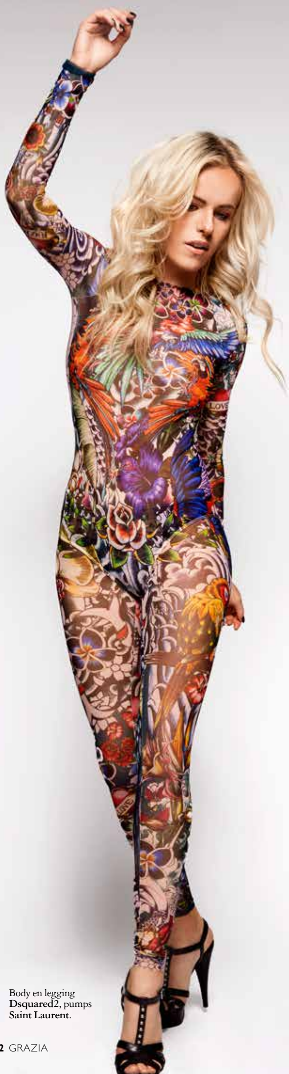
Body en legging Dsquared2, pumps Saint Laurent.

zit of niet. Daar voel ik me gewoon niet prettig bij. Maar als het met mode te maken heeft en je ziet toevallig een tiet, dan heb ik daar geen problemen mee.”