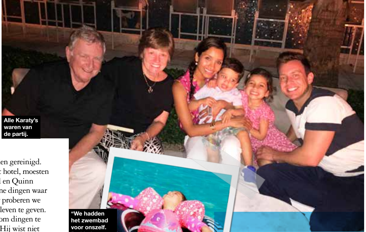
Alle Karaty's waren van de partij.