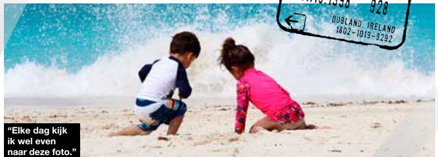
"Elke dag kijk ik wel even naar deze foto."