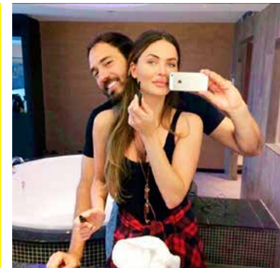
Even geen wuivende palmen en sandy beaches...