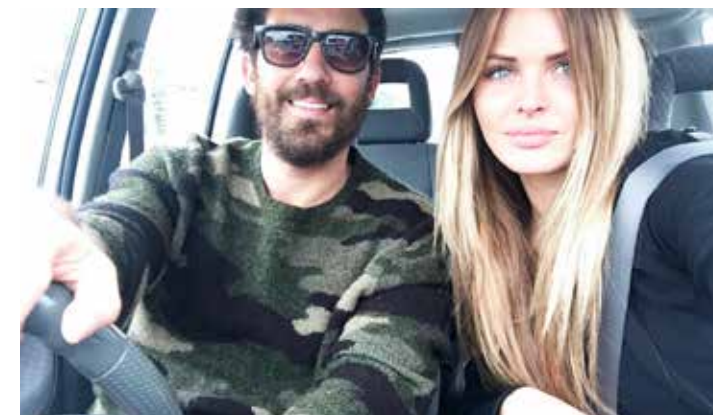
Misschien ooit weer terug naar Mexico?