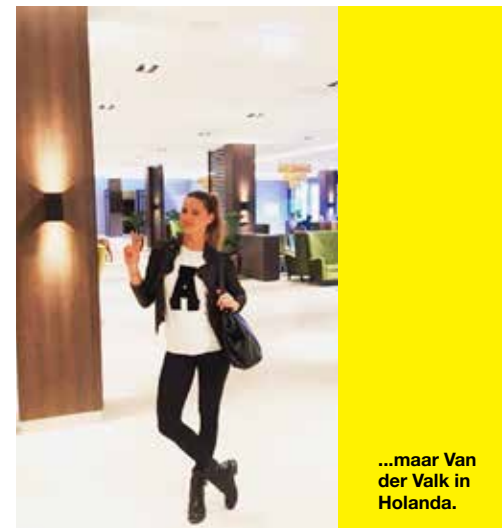
...maar Van der Valk in Holanda.