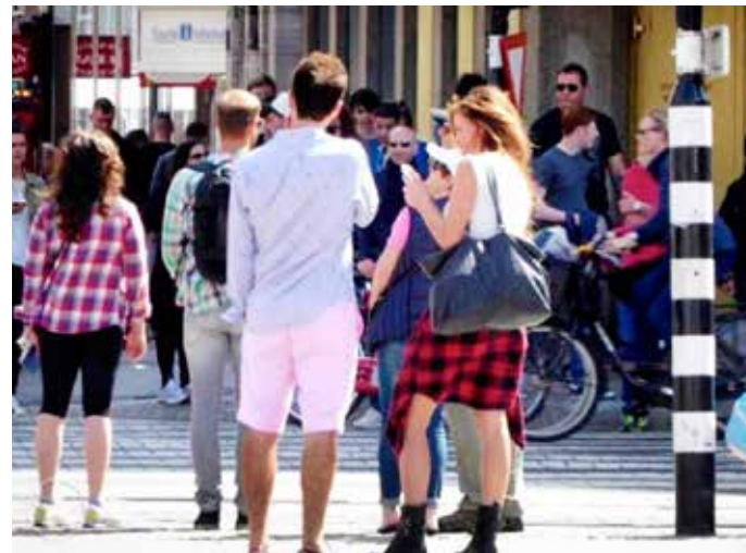
Genieten nu het nog kan, van een Sunday family walk.